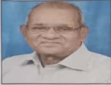
२५ डिसेंबर १९४३ ते ११ फेब्रुवारी २०२५