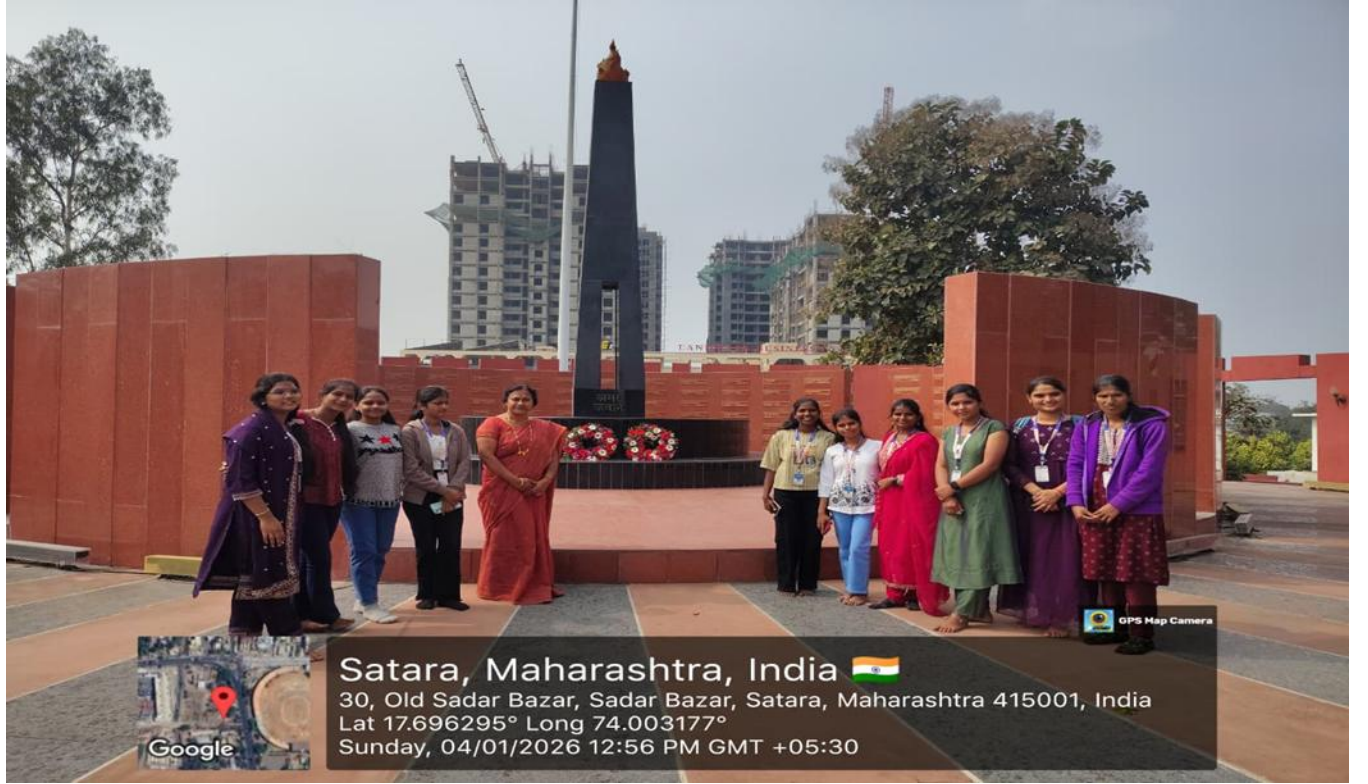
अखिल भारतीय मराठी साहित्य संमेलन, सातारा शैक्षणिक भेट