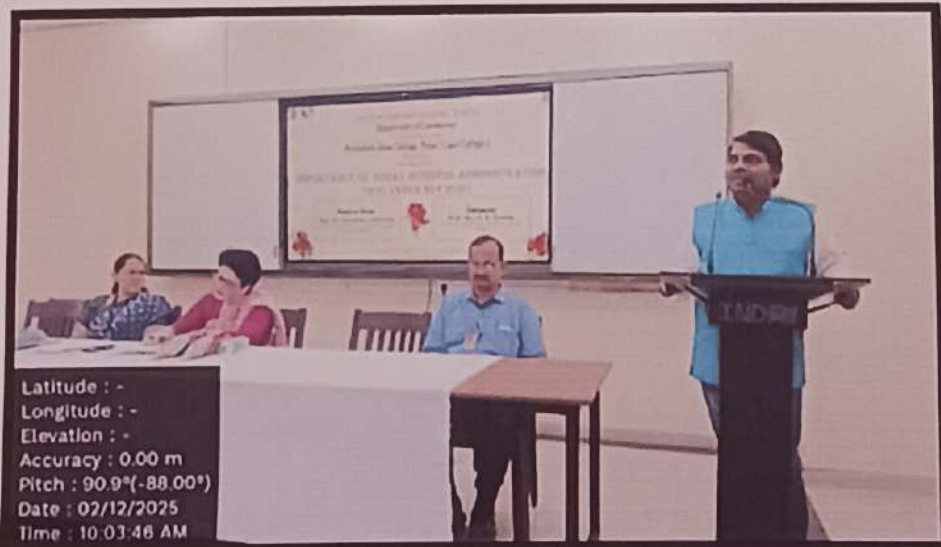
उपस्थितांना मार्गदर्शन करताना साधनव्यक्ती