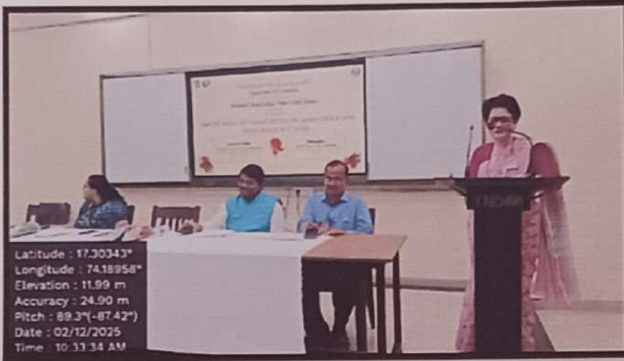
उपस्थितांना मार्गदर्शन करताना साधनव्यक्ती

Latitude : 17.30343° Longitude : 74.18958° Elevation : 11.99 m Accuracy : 24.90 m Pitch : 89.3°(-87.42°) Date : 02/12/2025 Time : 10:33:34 AM