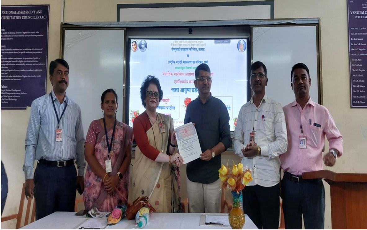
प्रमुख अतिथी मार्गदर्शन

वेणूताई चव्हाण कॉलेज कराड व शुश्रूषा सल्ला, मार्गदर्शन आणि प्रशिक्षण केंद्र इस्लामपूर यांच्यामध्ये सामंजस्य करार